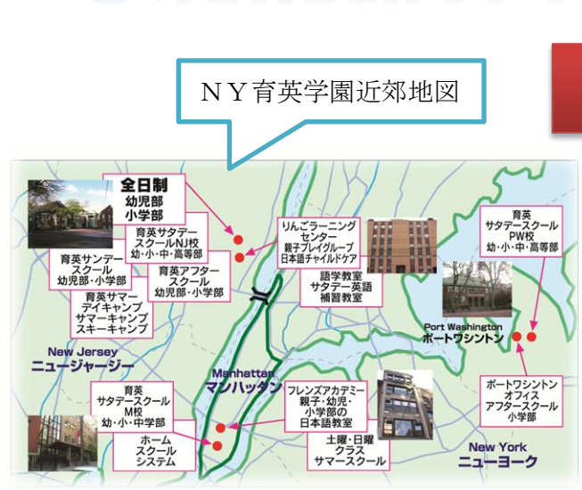
NY 育英学園近郊地図