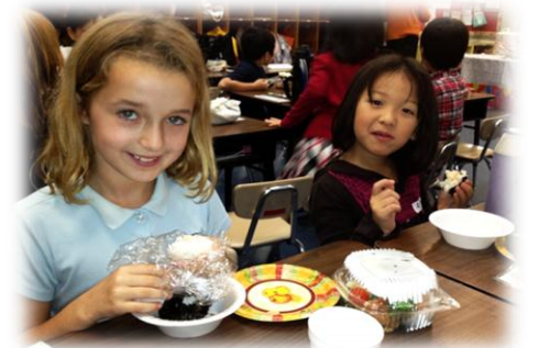
Students are enjoying handmade rice-balls at the exchange program.