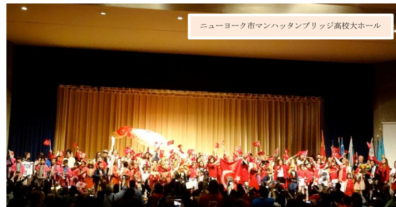
ニューヨーク市マンハッタンブリッジ高校大ホール

四月二十日(土) ニューヨーク市マンハッタンブリッジ高校の大ホールで開催されたトルコ「国際こどもの日」イベントに、ニューヨーク育英学園全日制部門小学部から、十名の児童が参加しました。 このイベントは、様々な国の子ども達が集まり、文化交流を通じて『こどもの日』を祝うものです。今年、トルコ、アルバニア、ブルガリア、日本、その他の国を入れ、八カ国の子ども達が集まり、民族衣装を身に纏い、ダンスや歌を披露しました。 浴衣や法被を着た子ども達が『だるまさんがころんだ』『はないちもんめ』『あんたがたどこさ』の遊びの後、『花笠おどり』を約八百人の前で披露しました。 踊り終え、舞台袖に入るや否や満面の笑みで「楽しかった!」「もう少し舞台上に立ちたかった!」「また参加したい!」と興奮して話す児童たちでした。