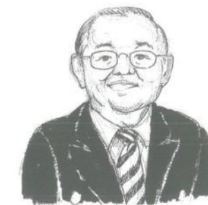
ニューヨーク育英学園学園長

現在、時代も変わり、多くの問い合わせや申し込みはインターネットで行なわれています。ホームページもあり便利になっていますが、まだまだ本学園のことをご存じない方も多くいらっしゃいます。そこで、以前、発刊しておりました本学園の機関誌を復活させることにいたしました。私達 Japanese Children's Society における現在の様子、また、新部門や新企画のこともお知らせたく、この“フレンドシップ”を送り出すことになりました。年3回の小さなニュースレターですが、地域の皆様と本学園をつなぐ架け橋となっていくてくれれば幸いです。