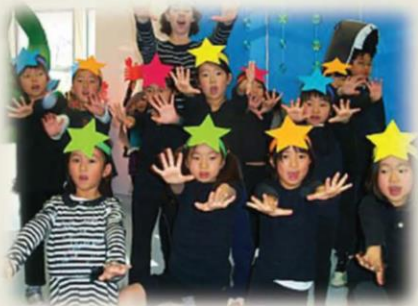
Students' performance at the rehearsal for School Festival