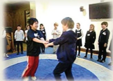
Bilingual Day :Visiting an American school in NYC