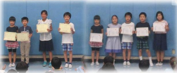
全日制小学部表彰の様子