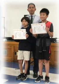
サタデーPW校 表彰の様子