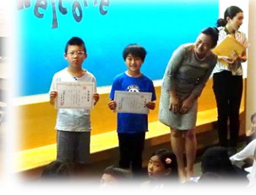
サタデーM校 表彰の様子