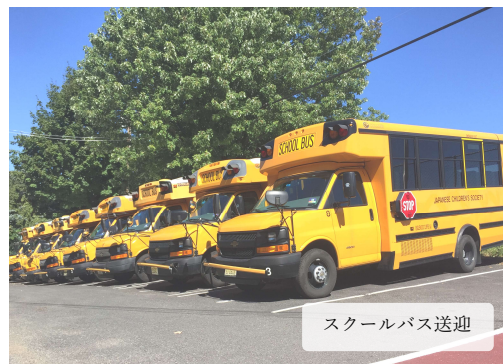
スクールバス送迎